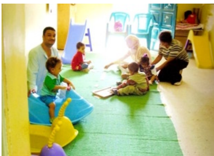
Kinderen in de crèche, opgevangen door vrijwilligers

Om het gebouw te kunnen opknappen en van het nodige meubilair en