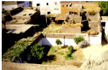
Zo ziet het dorp eruit vanaf het dak gezien!

Een kleine vervallen medische post, waar een verpleegkundige de noodzakelijke dingen doet.