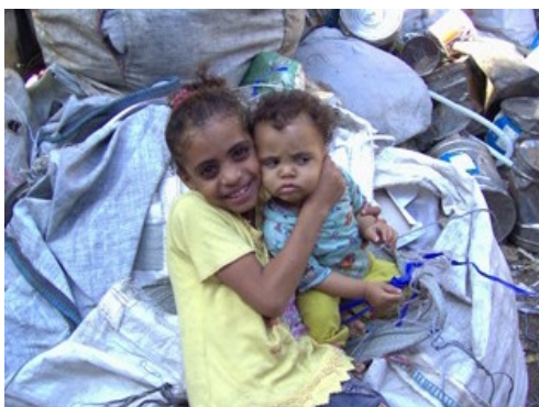
Kinderen in hun smerige leefmilieu

"De beelden staan op ons netvlies gebrand; die geur, die vieze stank van armoede, vergeet je nooit meer", schrijft Renate.