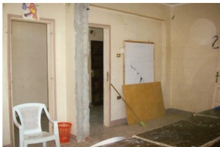
Toekomstige ruimte voor naschoolse studieopvang: het gat in de muur is niet afgewerkt, het bord is stuk, de meubels zien er niet uit.

Wat je ziet: oude kapotte tafels en uitgebroken muren om de ruimtes groter te