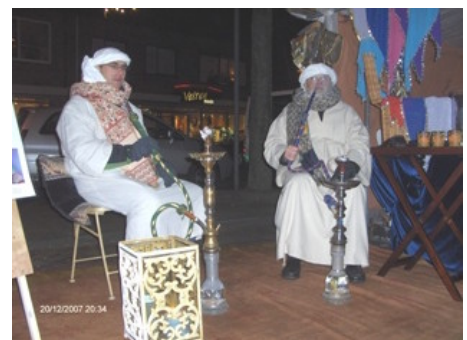
Twee "Egyptenaren" vestigen de aandacht op de stand van Stichting Teje

Op de kerstmarkt was Stichting Teje prominent aanwezig om haar werk spectaculair "onder de leu te kriegen" en te proberen nog wat geld in te zamelen voor projecten in Egypte. Allerlei spullen, meegebracht uit Egypte werden te koop aangeboden. Spulletjes geschonken door o.a. 'Brandputje', een aantal bloemstukjes, gemaakt door vrienden van Teje, vonden hun weg naar het publiek. Drie kinderen zamelden geld in bij de draaimolen. Met een aantal giften was de totale opbrengst zo'n € 1100,-.