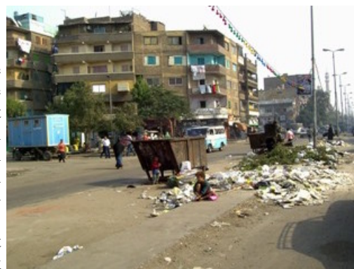
In deze viezigheid spelen de kinderen!

Op de weg er naar toe neemt de vuilnis langs de kant van de weg in hoeveelheid toe. Dan sta je plotseling oog in oog met een wereld die draait om vuilnis, viezigheid, ongedierte, stank en onmenselijke armoede. Smalle gebouwen van vier of zelfs zes verdiepingen hoog die voor een groot gedeelte gevuld zijn met vuilnis! En daartussen leven de mensen: mannen, vrouwen, kinderen. Ze verdienen 1 euro per dag met het sorteren van al dat afval. De slogan "de stank van armoede" is hierop duidelijk van toepassing. De poort van het huis van moeder Theresa wordt opgedaan door een bewaker. Bewaking schijnt nodig te zijn, omdat deze wijk geen wetten en regels kent. Het huis van moeder Theresa, een veilige vesting in een wereld van ellende. In het gebouw zijn gehandicapte kinderen, baby's en bejaarden ondergebracht. Zusters en een aantal helpsters verzorgen die. Helpsters: jonge meisjes voor wie geen plaats meer was in het eigen gezin. Om die reden zijn ze ondergebracht bij de zusters, waar ze een prima taak vervullen. De Stichting Teje helpt en is blij, dat ze dit huis kan steunen in de liefde en zorg voor die mensen, voor wie eigenlijk geen toekomst meer is. Er worden (stiekem!) nog wat foto's gemaakt om donateurs, scholen en allen die de Stichting een warm hart toedragen te kunnen laten zien, hoe belangrijk hun steun is.