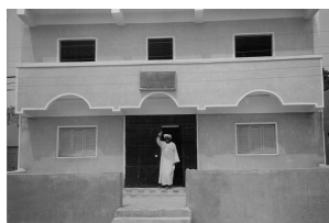
Zo ziet het er aan de buitenkant uit

Nu moet de binnenkant nog afgewerkt worden.