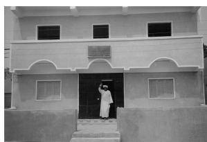
Zo ziet het er aan de buitenkant uit

Nu moet de binnenkant nog afgewerkt worden.